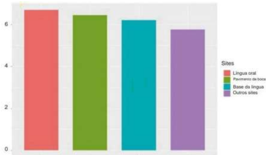
Figura 2: Apresenta a expressão de ECA2 em diferentes sítios orais em dias. (XU et al. , 2020)

O vírus da Sars-CoV-2 pode percorrer três caminhos para se apresentar na saliva. O Sars-CoV-2 no trato respiratório inferior e superior alcança a cavidade junto com as gotículas líquidas; usando o sangue pode entrar na boca por meio do fluido crevicular gengival; e pela infecção maior ou menor da glândula salivar, com a implicação liberação de partículas na saliva, por meio dos ductos salivares (SABINO-SILVA & JARDIM & SIQUEIRA, 2020).